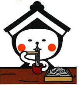
栃木市マスコットキャラクター「とち介」