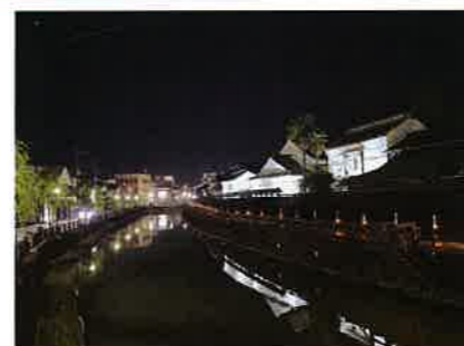
船頭さんと生徒さんが、 心を込めて作った竹あかり ぜひご覧ください!!

場 所: 常盤橋～幸来橋～巴波川橋(全長490m) 期 間: 令和3年11月1日(月)～ 令和4年2月28日(月) 問 合 せ: 栃木市観光振興課 ☎0282-21-2374