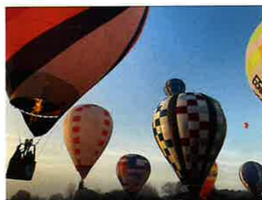
冬の澄み切った空に上がる気球をお楽しみ下さい。

場所: 藤岡渡良瀬運動公園 期間: 令和3年12月17日(金)~19日(日) 問合せ: 栃木市観光振興課 ☎0282-21-2374