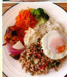
人気メニューの一つ ガバオ・ガイライス