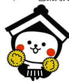
栃木市マスコットキャラクター「とち介」