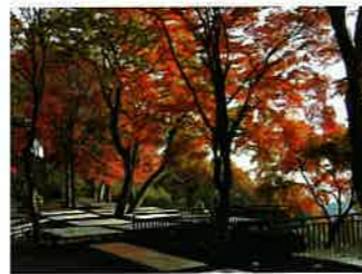
鮮やかな太平山の紅葉