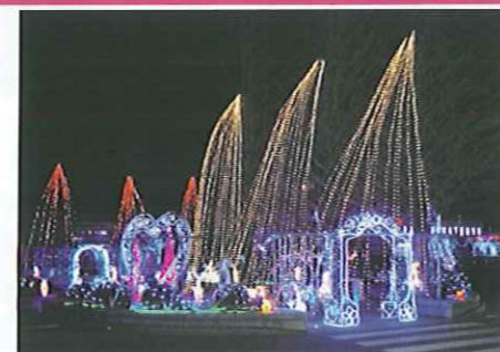
幻想的な輝きの世界へ！