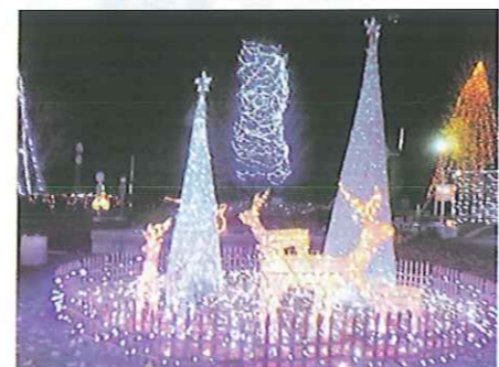
子供から大人までうっとり！