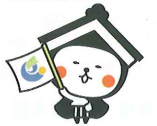
栃木市マスコットキャラクター「どち介」