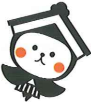
栃木市マスコットキャラクター 「とち介」