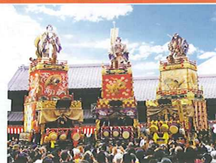
秋空に映える、色鮮やかな山車