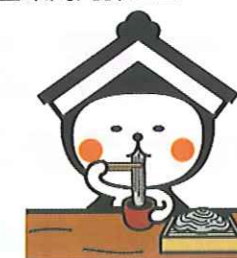
栃木市マスコットキャラクター「どち介」