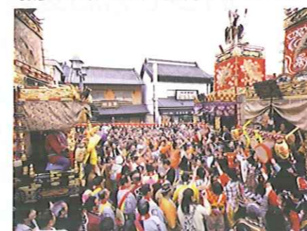
山車のぶっつけはスゴイ熱気！