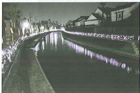
月明かりで白く浮かび上がる蔵の壁