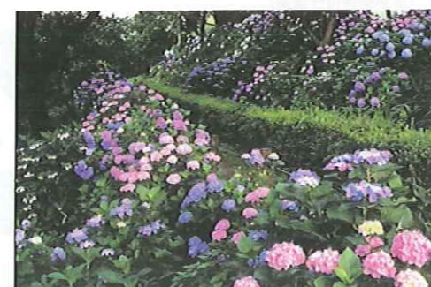
一面のあじさいには癒されます!