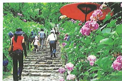
老若男女に愛されているあじさい