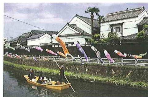
爽やかな春風にゆられる鯉のぼり