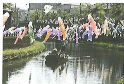
遊覧船から見る鯉のぼり