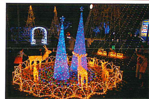
気分はすっかりクリスマス！