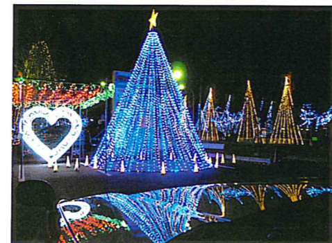
キラ☆キラのイルミネーション！