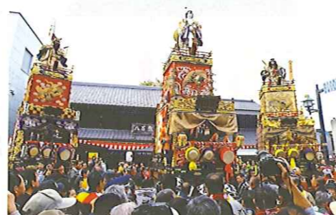
古くは江戸時代に造られた山車も！