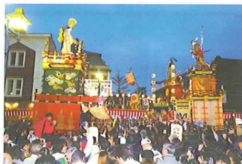
夕暮れの「ぶっつけ」は迫力満点！