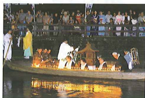
たくさんの方々が見守る