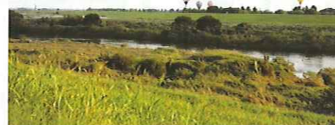
雄大な自然を感じながらのフライト