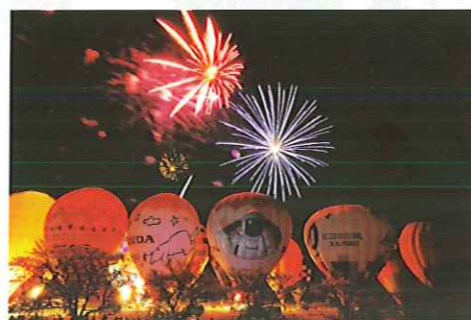
夜は花火と気球のコラボが最高！