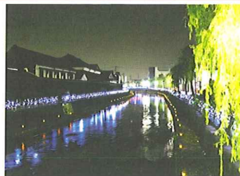
川沿いに続くイルミネーション