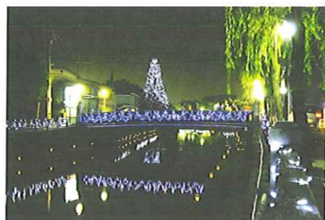
水面に映る景色は幻想的です！